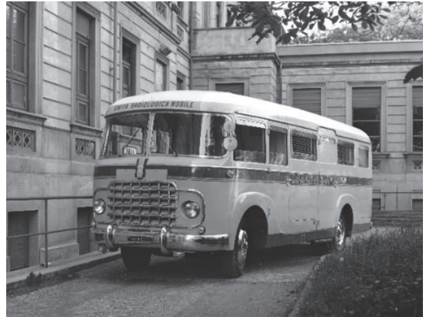
Figura 2 - L'autocarro schermografico alla Clinica del Lavoro di Milano (1961).

Per identificare con la massima precisione possibile il modello del veicolo, ci si deve rivolgere anche alla stampa automobilistica specializzata (21). Dovrebbe trattarsi di un FIAT 642 RN modificato (la sigla RN si riferisce al modello di autobus derivato dall'autocarro FIAT 642, dotato di pianale ribassato). Sono, infatti, attestati modelli automontati derivati dallo chassis FIAT 642 prolungato (Rangoni e Puricelli) (26) e dal modello 642RN2. Non è stata finora identificata l'Officina Meccanica che allestì questo autoveicolo speciale, ma è attestata l'attività di alcune carrozzerie: la Orlandi (26) o la Boneschi. La tabella posta sulla fiancata, riportante la dicitura