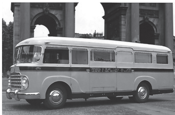
Figura 1 - L'autocarro schermografico all'Arco della Pace di Milano (1953/1957) (24)

Esisteva un apparecchio eventualmente trasportabile, ma la scelta effettuata dall'istituzione milanese fu analoga a quella adottata dall'ENPI: fu approntato un apparecchio schermografico mobile automontato. Nella letteratura specifica esiste un'immagine dell'autocarro della Clinica del Lavoro milanese, ripreso presso l'Arco della Pace di Milano ed essa non può essere riferita ad un periodo anteriore al 1953 e posteriore al 1957 (24) (figura 1).