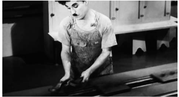
Figura 2 - Stringere i dadi