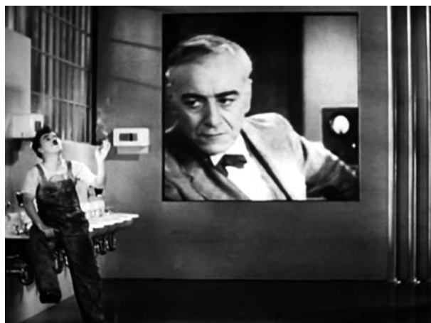
Figure 3 - Pausa della lavorazione Figures 3 - Working Break