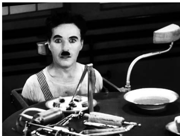
Figure 5 - Macchina nutri operaio Figures 5 - Worker feeding machine

Per la valutazione preliminare è stato utilizzato il modello proposto dallo Stato di Washington (19); come metodi di primo livello sono stati applicati