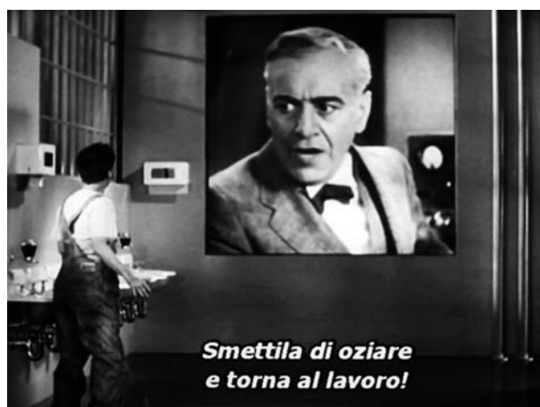
Figure 4 - Pausa della lavorazione Figures 4 - Working Break

te dall'immagine del datore di lavoro che in un video lo invita al rientro al lavoro. La pausa pranzo dura 15 minuti (dall'inizio del consumo del pasto nel reparto alla fine dell'esperimento con la macchina nutri operaio ( feeding machine ) (figura 5).