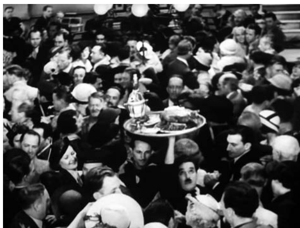
Figure 7 - Trasporto del vassoio (vedi posizione del polso) Figures 7 - Handling the tray (see the wrist position)

Possiamo quindi affermare che la sindrome di