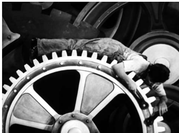
Figura 1 - Trascinamento negli ingranaggi Figure 1 - Dragging into the cogwheels

Modern Times è il primo film parlato di C. Chaplin composto di una serie di gag di spirito molto diverso. Le più buffe sono quelle dell'esperimento della macchina per nutrire in poco tempo i lavoratori, l'involontario (?) coinvolgimento dell'attore come capo popolo durante una manifestazione sindacale per aver afferrato una bandiera (verosimilmente rossa) caduta da un camion, il destreggiarsi con un grande vassoio come cameriere travolto dalle danze